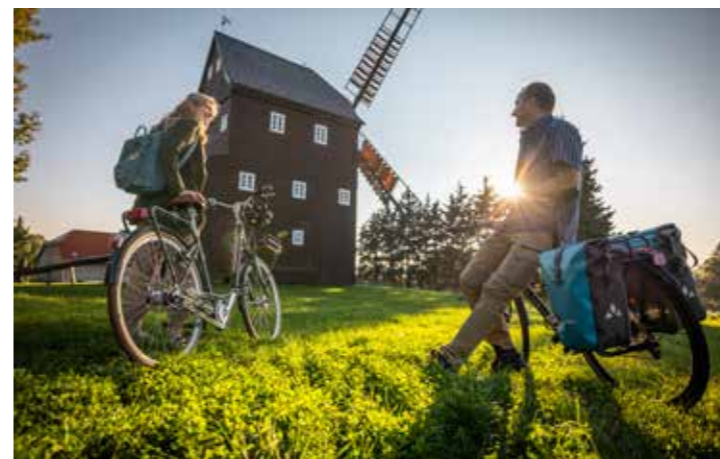
Zwillingsradweg Oderwitz