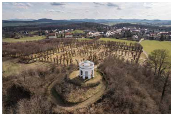
Herrnhuter Altan, Foto: (DJI) Mushroom Productions

Die Kooperation aus der Touristischen Gebietsgemeinschaft Naturpark Zittauer Gebirge/Oberlausitz e.V. mit dem Naturpark Zittauer Gebirge – DAS OUTDOORLAND und den Städten Zittau, Ostritz und Herrnhut strebt ein Konzept an, welches die Entwicklung und Qualifizierung von touristischen Angeboten aufzeigt.